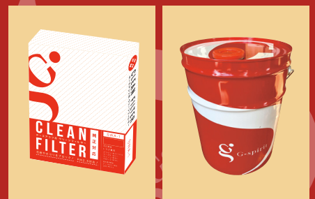
エアコンフィルター